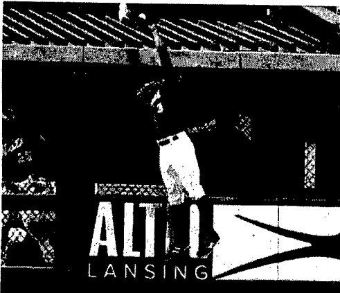
A LA BOMBA... Carlos Granderson golpea el bateo de Chris Coghlan, en la segunda entrada, que pudo significar un jonrón y la primera carrera de los Cachorros, en el segundo juego de la serie por el campeonato de la Liga Nacional.