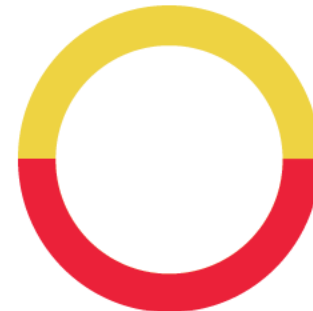
ENLACE GLOBAL PM S/INTERESES (Saldo inicial de $28.54)