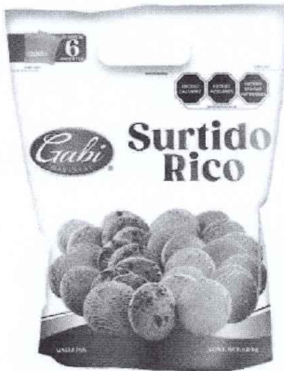
GALLETA GABI SURTIDO RICO 1.2